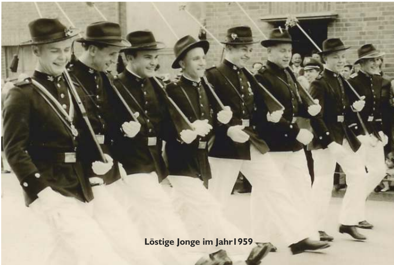
Löstige Jonge im Jahr 1959