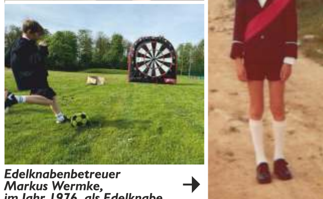
Edelknabenbetreuer Markus Wermke, im Jahr 1976, als Edelknabe